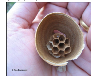
Nid de fondation