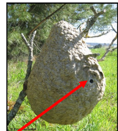
Nid en fin d'année

Octobre : le nid peut mesurer jusqu'à 1 m de haut !