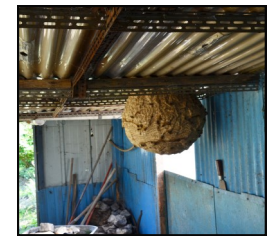
Nid sous un abri