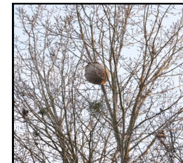
Nid dans un arbre